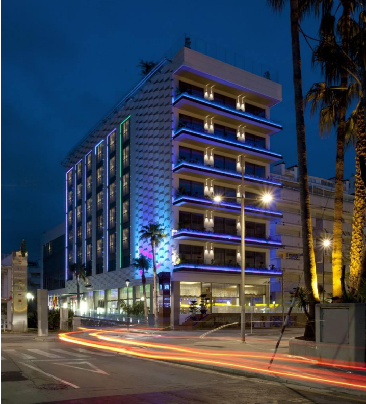
Hotel MiM Sitges

Ya se conoce la fecha y el lugar de celebración de la próxima edición de la V Conferencia BioEconomic® Certificación LEED® , la certificación se centrará en Hoteles y Edificios. Tendrá lugar en el Hotel MiM Sitges Boutique & Spa, el 23 de Febrero de 2018, con la previsión de duplicar el número de asistentes.