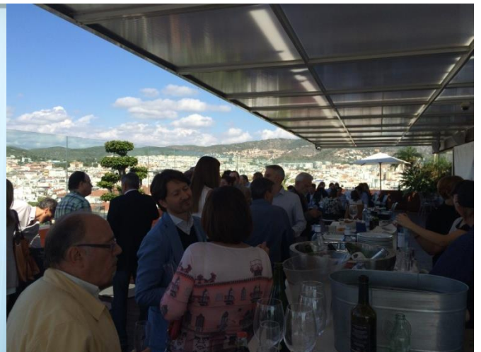
Networking en el Sky Bar en IV BioLEED

¿Interesado en participar en la V Conferencia BioEconomic® Certificación LEED®?