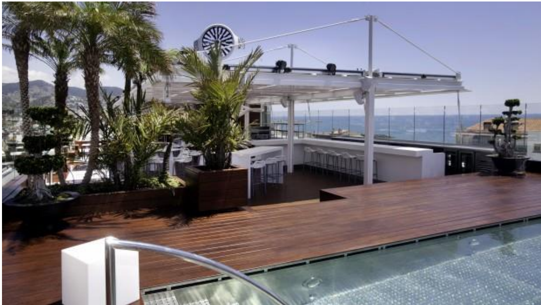
Sky Bar - Hotel MiM Sitges

Las cifras de la última edición de la IV Conferencia BioEconomic® Certificación LEED® reflejan su éxito como evento de referencia en el Diseño y Construcción Sostenible con la Certificación LEED® en Hoteles y Edificios, con cerca de 100 profesionales registrados .